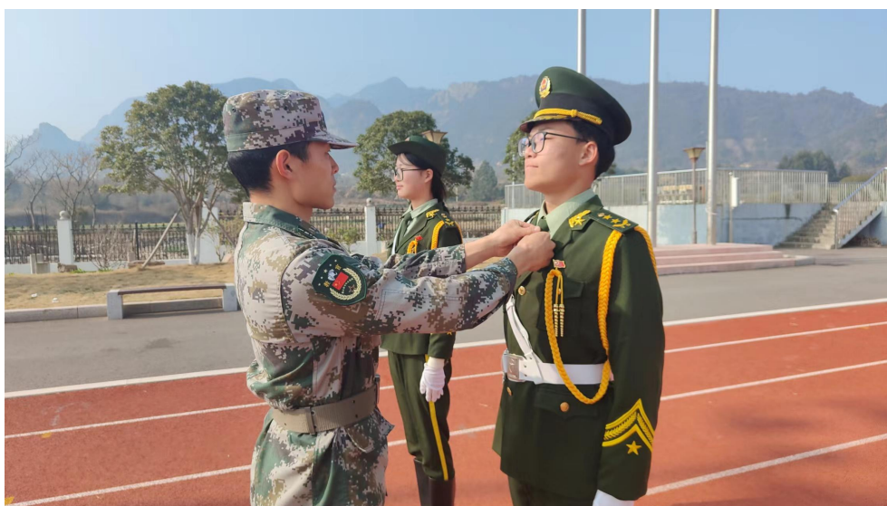
图 4 驻校教官为“国旗班”队员整理仪容

驻校教官在校内展现出军人形象，律己达人的耳濡目染，营造崇军拥军的良好氛围，让更多的学生愿意选择参军入伍。近三年，我校共有 19 名学生通过层层选拔投身绿色军营，保家卫国贡献青春力量。此外，我校还是温州市拥军优属、拥政爱民共建示范单位和乐清市黄华女子民兵哨所征兵定点单位。