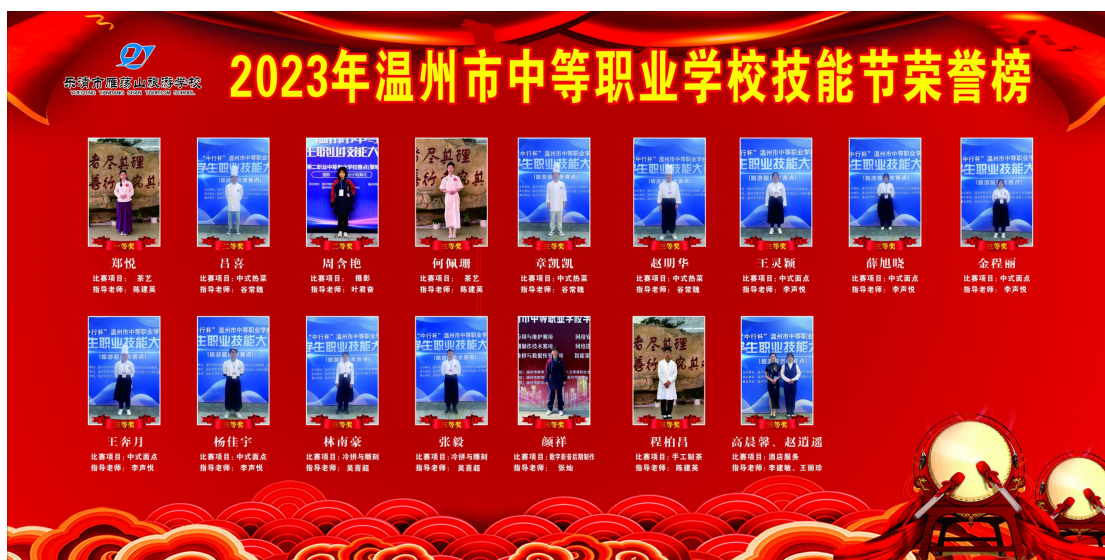
图 8 2023 年温州市技能节荣誉榜