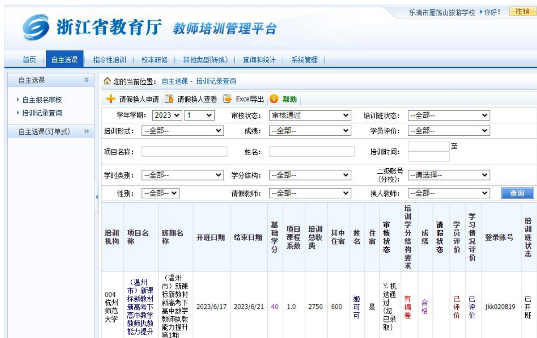
图 11 教师培训实施情况

学校拥有教师队伍建设及培养培训规划，有教师专业发展规划。学校通过理论学习、全员培训、师徒结对、教学同伴、教师论坛、经验交流、以赛促研等为基本形式，为教师参与校本研修创设平台和创造条件，促进教师专业化发展。2023 年，学校教师参加省市级各类培训 76 人次，其中 90 及以上学分 26 人次，总培训学分达 4322 学分。圆满完成培训任务。