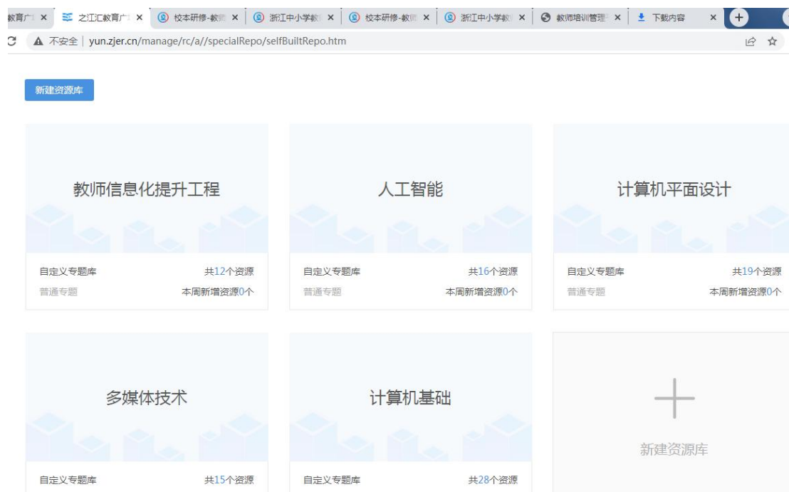
图 10 数字化资源建设情况

数字化资源的建设以之江汇为平台，搭建校园资源库，由于刚刚起步，建设资源还不是很丰富。正在努力推广。