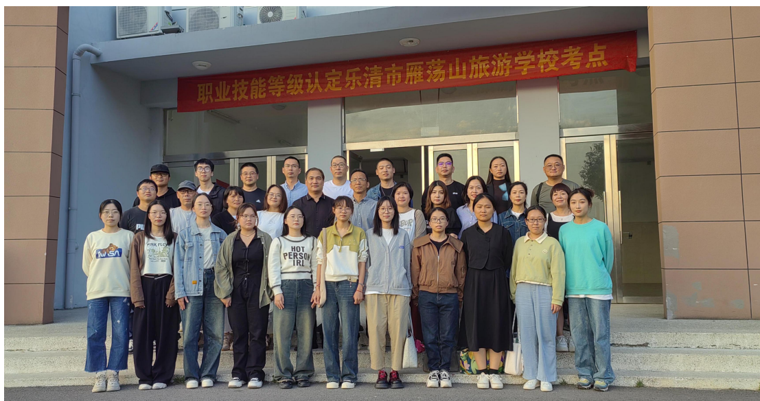
图 12 青蓝工程师徒结对

10月30日下午，在校会议室隆重举行雁旅2022学年新教师师徒结对仪式。学校行政领导、各科室负责人、新教师及指导师参加了本次仪式。