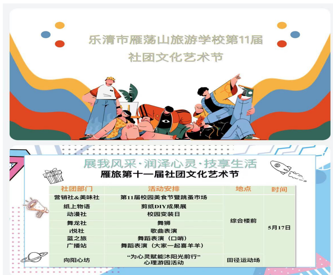
图 5 雁旅第十一届社团文化艺术节 1

礼仪队是旅游学校的特色社团之一，经过身高的选拔，综合素质的审核，为外出礼仪实践作好准备。志愿导游，服务游客，精彩讲解，青春风采！1995 年 3 月份雁荡山旅游学校成立了青年志愿者服务队——义务导游，之后每年 3 月份我们均在雁荡山国家级 5A 风景名胜