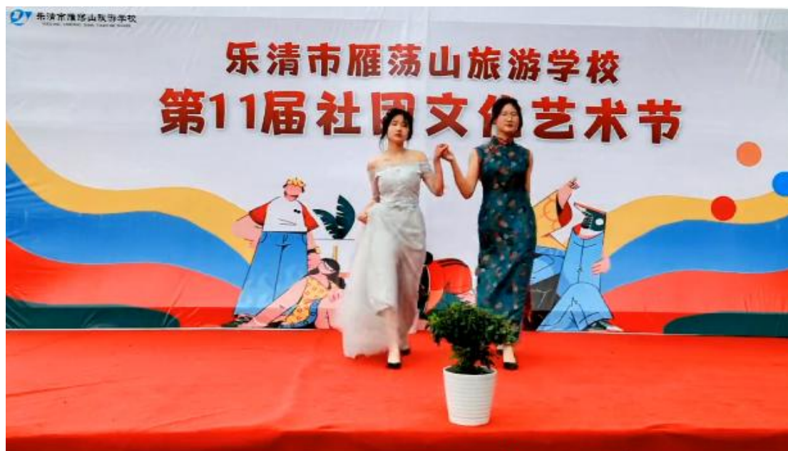
图6 雁旅第十一届社团文化艺术节 2

此外，学校“向阳心坊”心理社团还组织了“为心灵赋能，沐阳光前行”心理游园会，活动集“体验性”、“趣味性”、“教育性”为一体，共分为三大类：头脑挑战类、艺术疗愈类和团辅活动类。在活动中，同学们时而卷入头脑风暴的浪潮，时而沉浸在精妙绘制的旅程，时而跌进欢乐互助的海洋中：他们获得了成长、疗愈与快乐。