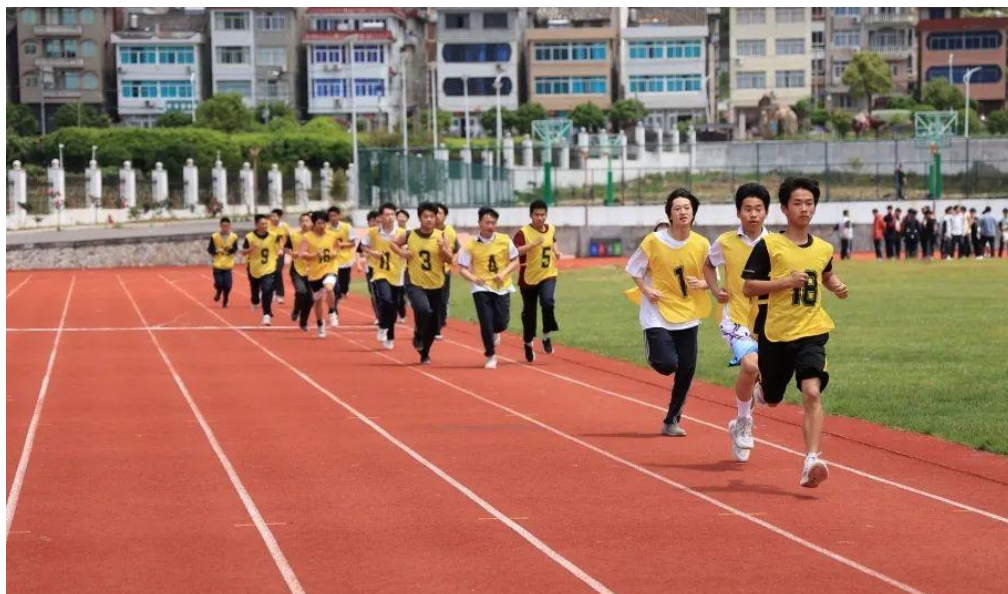
图 2 坚持阳光体育锻炼