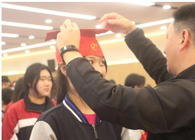
图 13 成人仪式授帽

2. 2023 年成人仪式暨高考励志大会：成人仪式是每个学生成长道路上的重要节点，标志着他们即将踏入成年社会的大门。为有效培育和践行社会主义核心价值观，切实增强广大青年学生的共青团意识和社会公民意识，2023 年 5 月 3 日乐清市雁荡山旅游学校举办“传承五四精神、勇担社会责任”主题的成人礼活动。