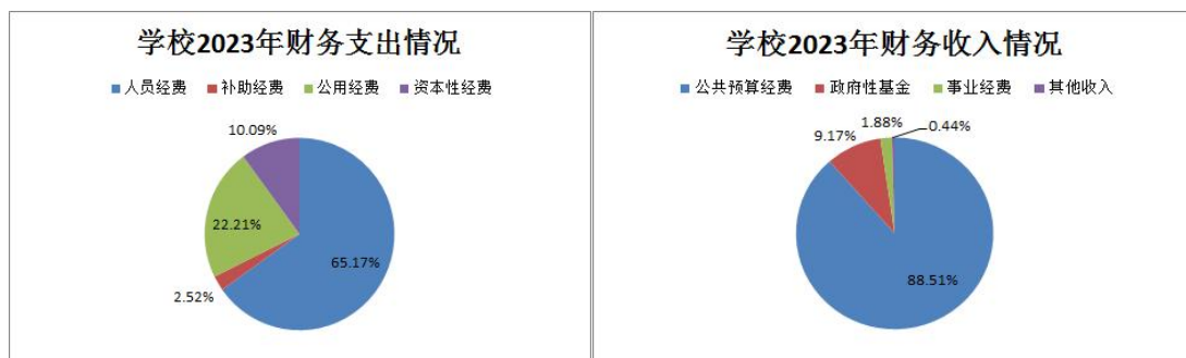
图 17 学校财务支出情况图

2348.90 万元，政府性基金收入 243.23 万元，财政专户拨事业费收入 50.00 万元，其他收入 11.65 万元。人员经费支出 1725.45 万元；对个人和家庭的补助支出 66.62 万元；公用经费支出（日常公用经费+项目支出）588.13 万元，生均 3595.00 元；资本性支出 267.25 万元。在资金的有效支持下，确保了学校各方面的经费支出，使得日常教学、师资培训、技能竞赛、外聘引进等方面平稳中见提升。