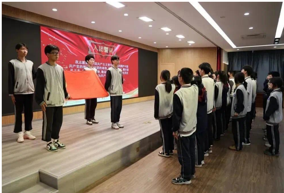
图 16 新团员入团仪式 2