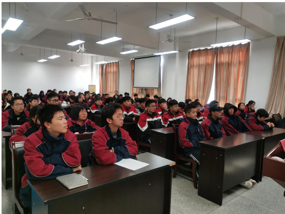
图 9 寒假勤工俭学动员大会

2023 年寒假勤工俭学参与的学生人数在 102 人，安排在 3 个酒店，于 1 月 15 日前往各勤工俭学点，正月十五左右回校，每日酒店给予 110-120 元以上的报酬。本次安排从学生人数统计发安全意向书、整理学生信息、开勤工俭学学生动员大会，中间学生多次修改等。整个勤工俭学工作历时 1 个月。为了做好学生寒假勤工俭学工作，实训处制定了 2023 年寒假勤工俭学奖惩制度和探望学生工作安排计划表。