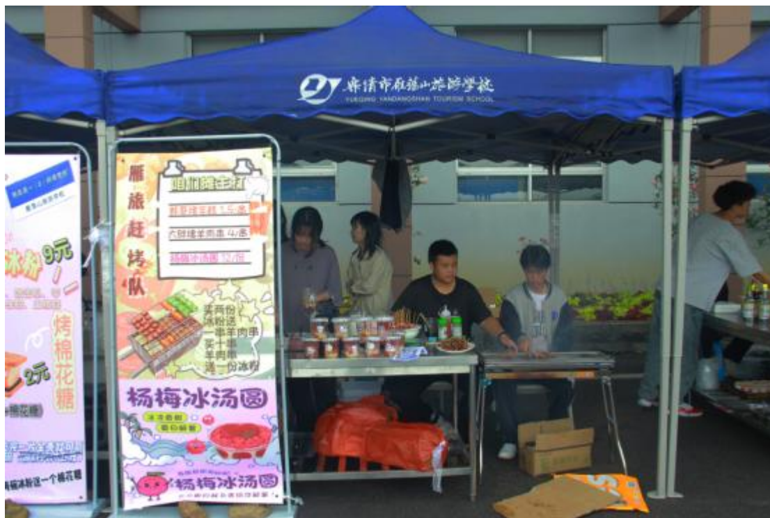
图7 第十一届校园美食节暨跳蚤市场