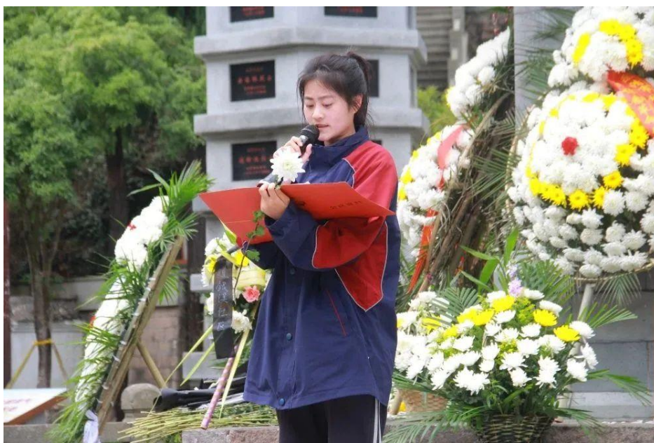
图1 雁荡山烈士墓瞻仰革命先烈

展缅怀革命先烈，弘扬爱国精神祭英烈暨义务导游活动，以培养学生树立“技能成才，强国有我”的职业理想。