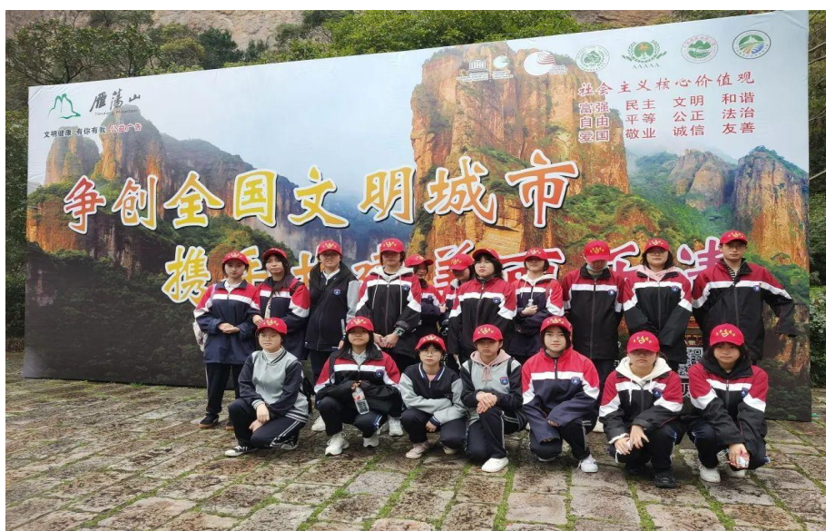
图 3 学生志愿者服务助力文明城市创建

规范校园文化墙；开展传统文化拓展课堂和社团文化；制定精准的管理制度。通过形体练习，礼仪服务，文明风采及志愿者等活动，培养学生三仪形象：做到整洁的仪容，得体的仪表，优雅的仪态；培养四美品行：形象美，语言美，行为美，心灵美；形成五好氛围：做好人，存好心，说好话，读好书，学好技能。